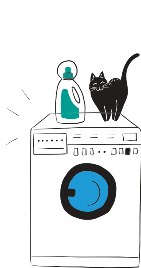
Mașini de spălat rufe