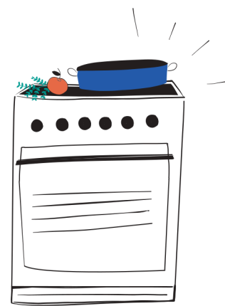
Plite electrice (inducție) Cuptoare